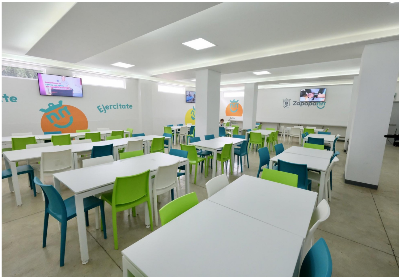
Branding del comedor de personal del Hospitalito