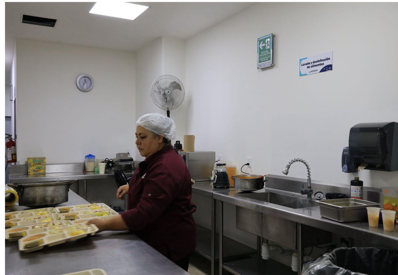
Instalación de señalética en el Hospitalito